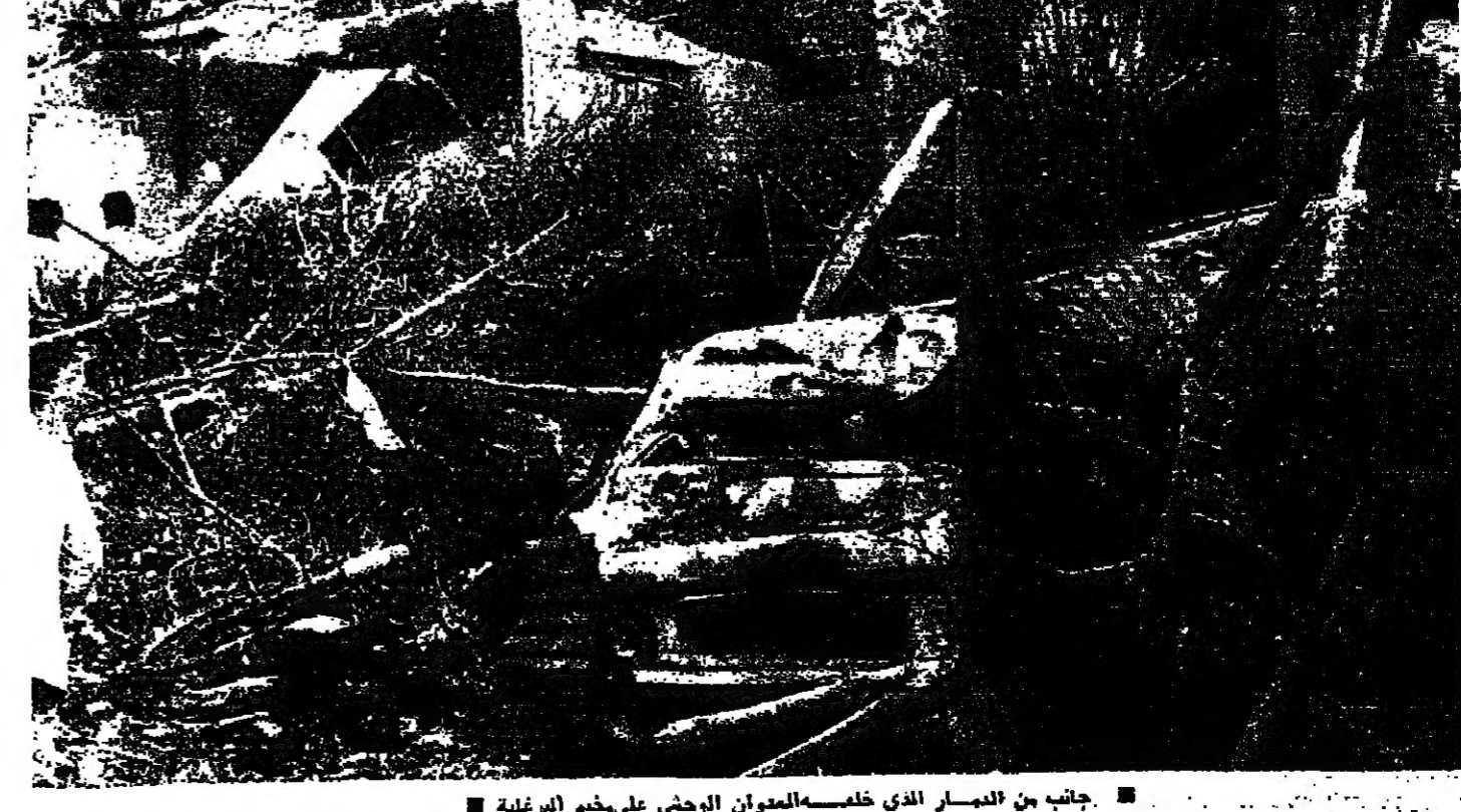
جانب من الممار الذي خلفه العدوان الوحشي على مخيم البرغلة

بعد الظهر : تعرضت منطقة صور في جنوب لبنان لعدوان جوي صهيوني وحشي استهدف الاجزاء السكنية وبيوت المدنيين . فقد هاجم طيران العدو في الساعة الواحدة ظهر اليوم عددا من المناطق في قضاء صور . وركز صف الطيران على منطقة البرغلة اذ نصف ساعة . وتصدت قوات ميليشيا الثورة وقوات المقاومة الشعبية لطائرات العدو الحرة ببسالة وشجاعة . وتابع البيان : وتشعر المعلومات الأولية الى تدمير ٥٠ منزلا واصابة عدد كبير من المدنيين باصابات مختلفة نتيجة القصف . وستدعو « وكالة الانباء الفلسطينية » براسي الصحف ووكالات الانباء لزيارة الأماكن التي تعرضت للعدوان . من جهة ثانية تعرض خراج قريسة رابية - عين الشعب - الشهرية ) لقصف مدفعي الساعة الخامسة صباح أمس ، استمر حتى السادسة . وفي السادسة والنصف وسع الاسرائيليون تصميمهم القمعي ليشمل خراج الجبسية - حلتا - المحيريات . كما تجدد القصف في ساعات الظهر لفضواحي شيما . ونجح عنه ضرر بالزروعات .